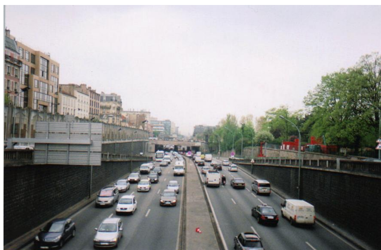
Vue du boulevard périphérique parisien au niveau de la porte d'Orléans